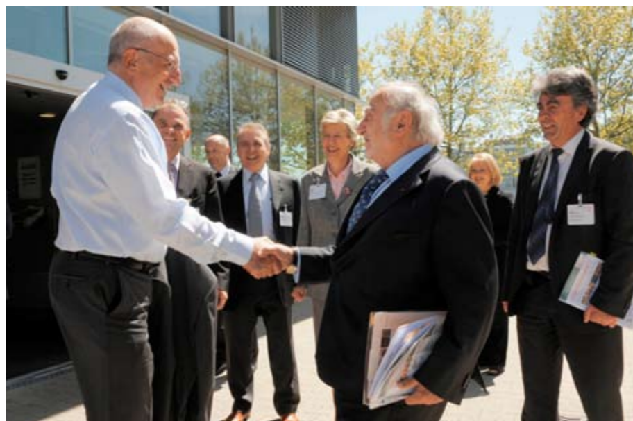
RENCONTRE AU SOMMET L'an dernier, le conseiller fédéral Pascal Couchepin et le patron de Swatch Nicolas Hayek figuraient parmi les orateurs phare du forum, tout comme Chiara Simoneschi-Cortesi, la présidente du Conseil national.

Au total, en six éditions, plus de 674 personnalités ont été présentées (parfois la distinction comprend des duos, des trios, voire des équipes imposantes...). Particularité de ce millésime 2010, la moitié des textes de présentation ont été rédigés par d'anciens lauréats. La rédaction les remercie chaleureusement d'avoir prêté leur plume à une meilleure connaissance de ceux qui font la Suisse romande. ◦