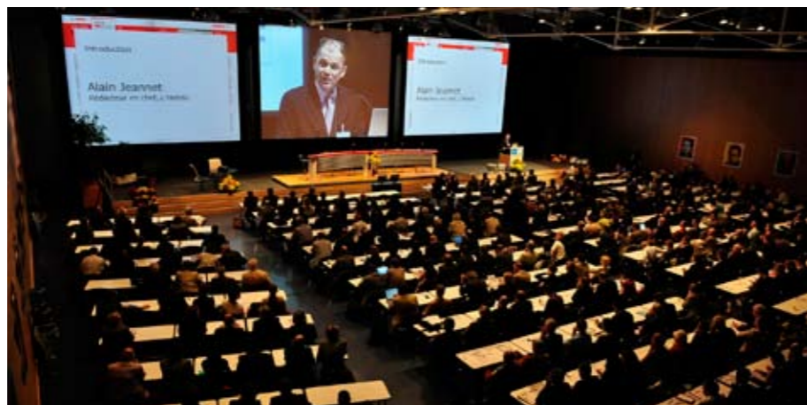
AMPHIMAX PLEIN À CRAQUER L'auditorium de l'Université de Lausanne accueille le forum depuis 2006 dans une ambiance studieuse.